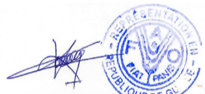
Dre Lisette TONGUE KOHAGNE Représentante a.i de la FAO en Guinée

Date de clôture : 26 mai 2026 à 14h 00 T.U